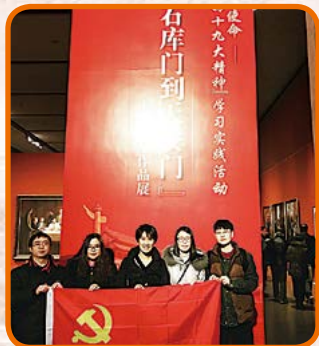
中共上海联豪食品有限公司 支部委员会