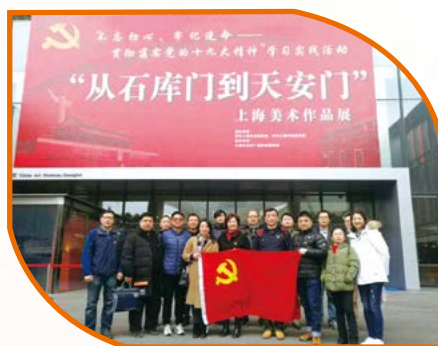
中共上海爱森肉食品有限公司 第二党支部委员会

这是一次呈现历史质感的展览，从硝烟弥漫的战火托孤，白色恐怖下的星星之火，到抗战结束的翻身作主，建设家园的星星之火……96幅作品演绎着中国共产党走过的96年卓越历程，用艺术的形式诠释出“不忘初心、牢记使命”的十九大主题。