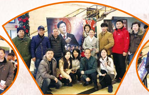
中共上海正广和饮用水有限公司委员会