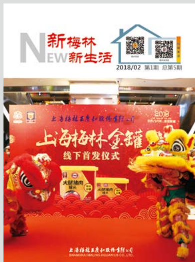
新梅林 新生活 月刊 2018年2月 第1期 总第5期