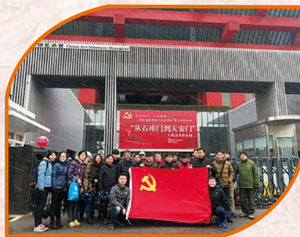
中共上海正广和饮用水有限公司委员会