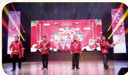
上海梅林食品有限公司 三句半《迎新春，启新程》