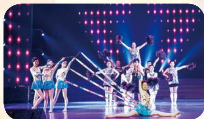
上海冠生园食品有限公司 舞蹈《炫彩青春》

与此同时，为体现职工快乐工作、美好生活的精神面貌，职工自编自演的八个类型丰富的节目贯穿于表彰大会，有身边人身边事的感动，有赏心歌舞贴心情景的感染，高潮迭起，精彩纷呈，最后，整个大会在光明食品集团出席领导、梅林股份班子成员和演职人员齐唱《我爱你中国》《明天会更好》的美好歌声和祝愿中成功落下帷幕。