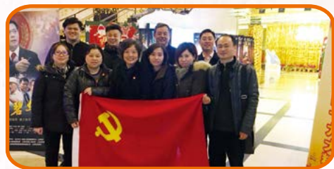
中共上海正广和网上购物有限公司 本部支部委员会