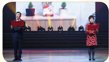
上海市食品进出口有限公司 朗诵《读书》