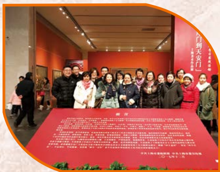
中共上海市食品进出口有限公司 总支部委员会

本次学习实践活动使每一位党员深受教育，共同在美术展中汲取精神力量。大家纷纷表示将在践行十九大“不忘初心”的使命中更加奋力前行，为“中国梦”添砖加瓦。