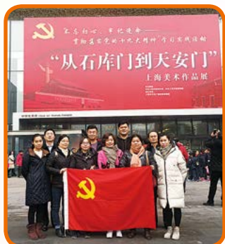
中共上海正广和网上购物有限公司 本部支部委员会