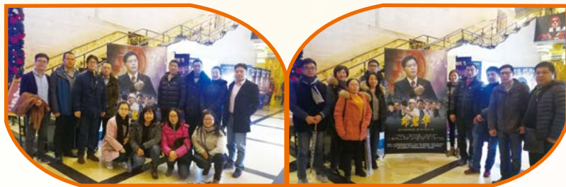
中共上海爱森肉食品有限公司委员会