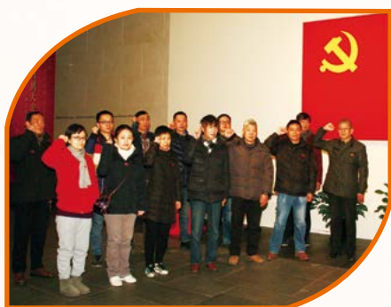
中共上海梅林正广和有限公司 销售分公司支部委员会

为了学习贯彻党的十九大精神，2018年新年伊始，梅林股份所属各企业组织全体党员及积极分子分批前往中华艺术宫参观了上海重点文艺创作作品“从石库门到天安门”美术作品展。上海美术作品展作为学习实践活动党性党课系列教育的重要内容，引导广大党员真正理解美术作品背后的精神实质和思想内涵，使之入脑入心。