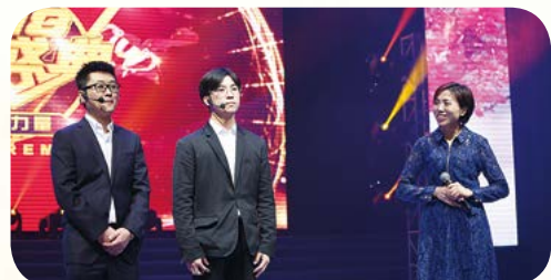
上海爱森肉食品有限公司小品《爱森就是力量》

春》的上演，大会正式拉开序幕。《创新品》《赢新境》《启新程》的“三新”作为三个主题篇章，以生动的视频揭晓表彰了2017年技术工艺创新、管理创新、销售创新、服务创新、新品销售、安全知识竞赛、包装设计、优秀组织八个种类66个集体和个人奖项。本次劳动竞赛旨在通过全方位的项目载体，进一步提升全员创新、创效意识，全面推动梅林股份各所属企业在管理创新、技术工艺创新、服务创新、销售创新等劳动竞赛活动水平的提升，使梅林股份公司成为优秀产品的提供者、优秀生活方式的创造者，精致生活的引领者。