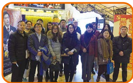
中共上海联豪食品有限公司支部委员会