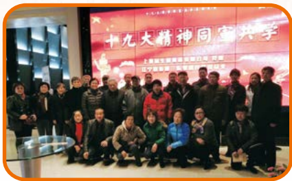
中共上海冠生园食品有限公司委员会